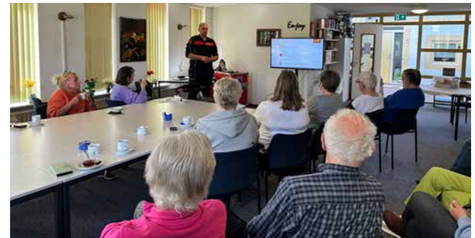
De bewoners van woongebouw Randmeer in Medemblik luisteren naar de presentatie van de brandweer.

In al onze woongebouwen hangt inmiddels een poster waarop onze