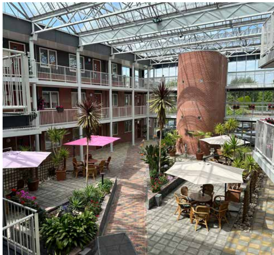
De binnentuin van woongebouw Minnewei kan altijd op veel complimenten rekenen.