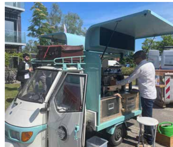
Ruud's Coffeabar zorgde voor een extra warme en uitnodigende sfeer.