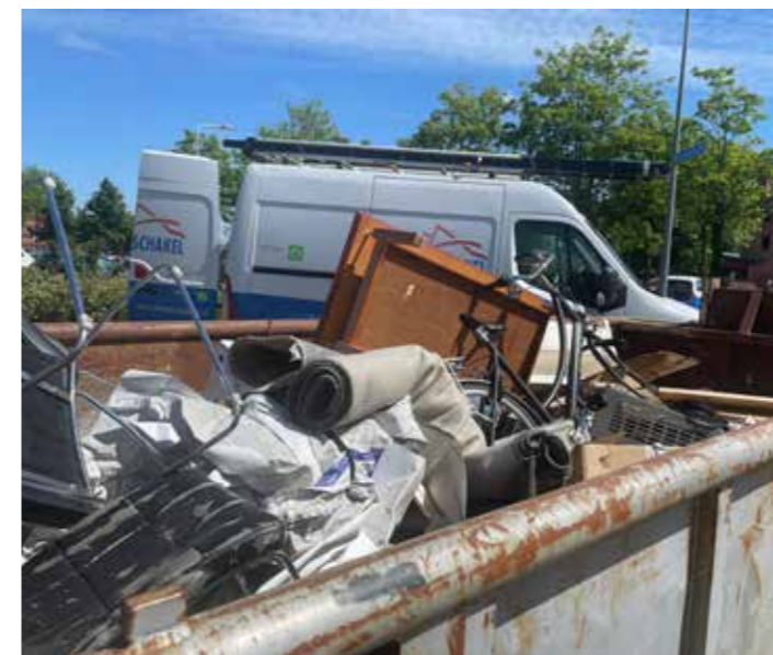
De container voor grof afval op de Dirk Veermanhof raakte al snel vol.