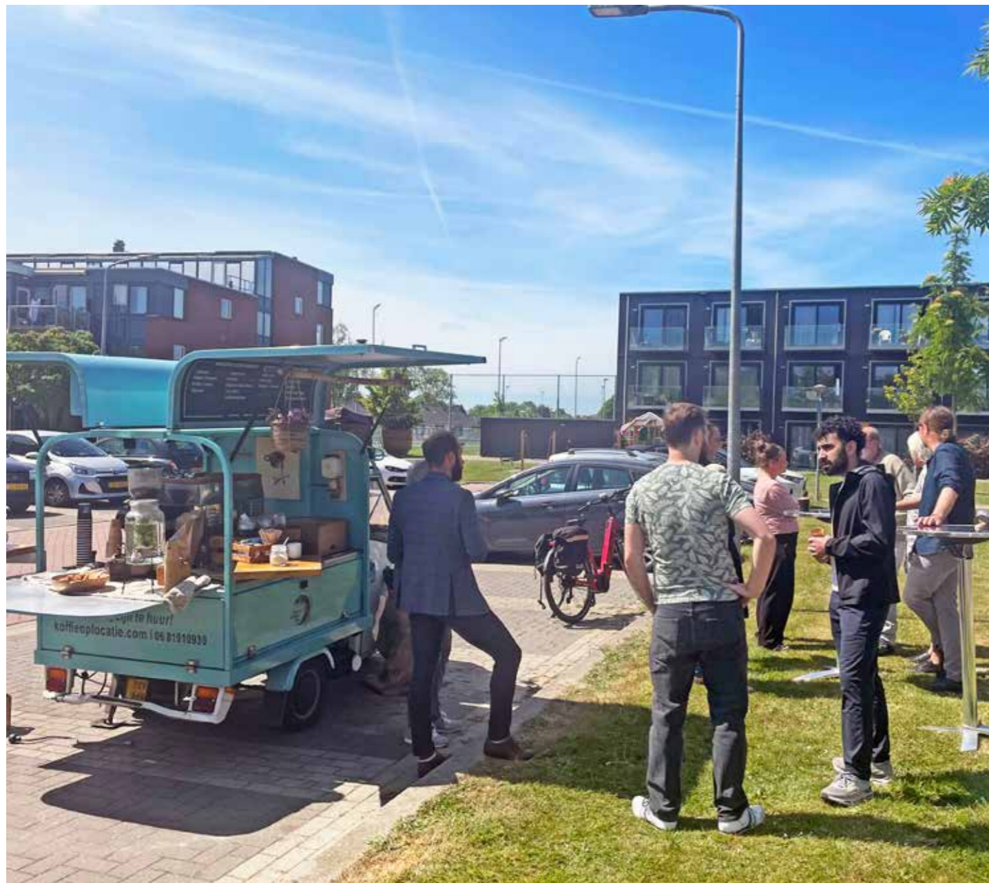
Bewoners en medewerkers van De Woonschakel zoeken met elkaar de verbinding op.

We kijken met veel plezier terug op deze mooie dag en danken alle bewoners voor hun betrokkenheid en inzet. Samen houden we onze buurten leefbaar, schoon en gezellig!