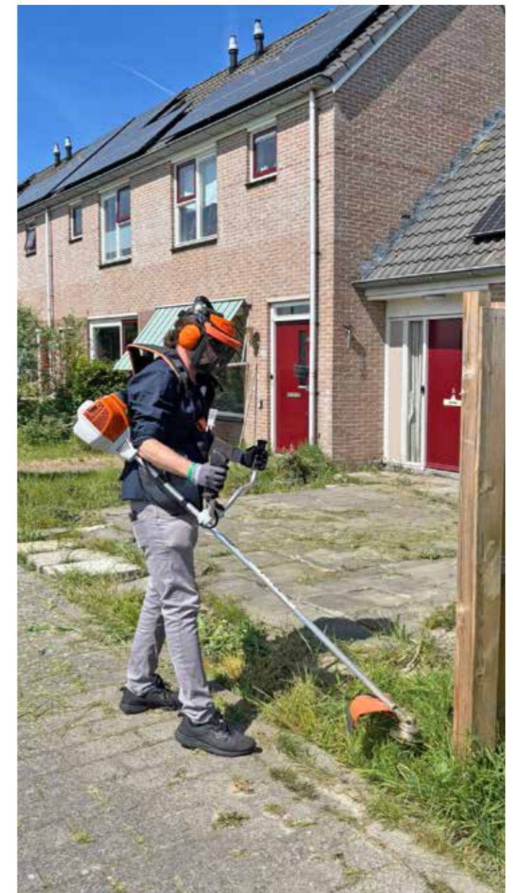
Ook sommige tuinen kregen een flinke opknopbeurt.